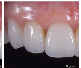
Initial Soft Tissue C ontour